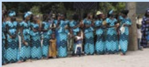
Danse des filles de BOUHÈNE

APPEL À COTISATIONS : l'adhésion à APPY reste à 15 €, et couvre l'année scolaire, merci de penser à votre renouvellement dans l'été.