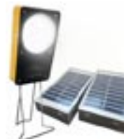
Elèves avec leurs lampes et la station de recharge