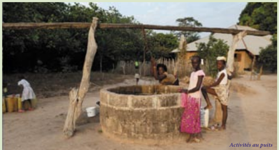
Activités au puits