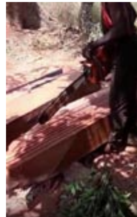
Fabrication de planches

Pour rappel, cette digue permet aux villageois de relier Youtou à Kaguitte, autre village situé à environ 8 kms en passant par les rizières