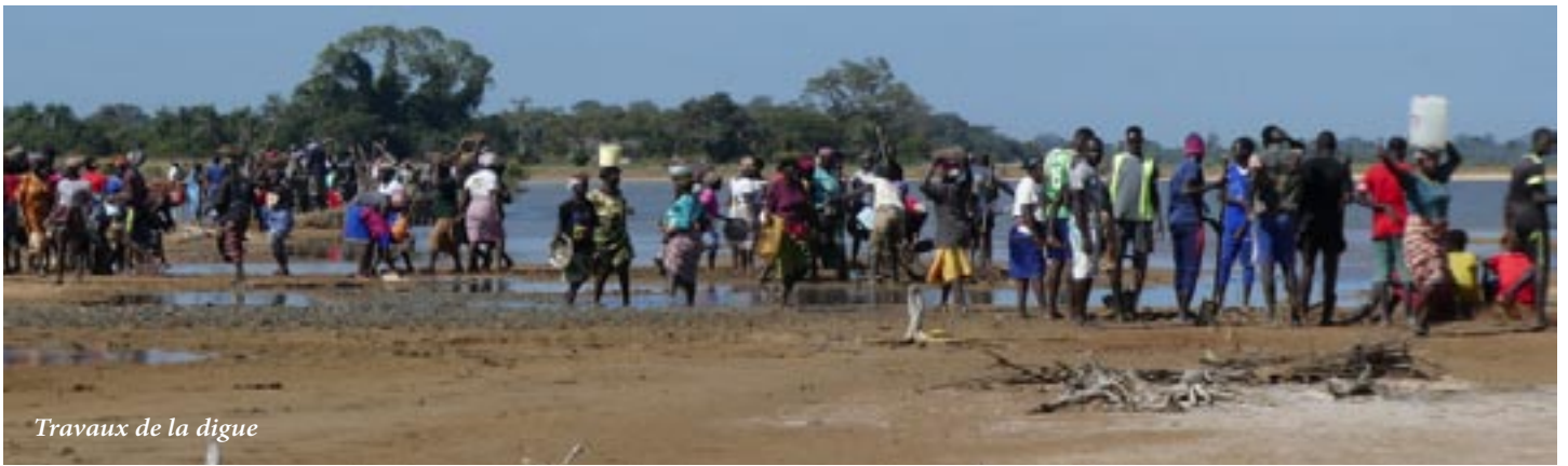
Travaux de la digue