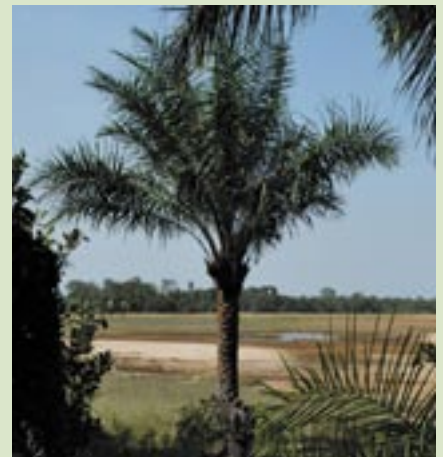
Autour du village