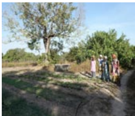
Jardin des femmes

Une rencontre a pu être organisée avec les femmes de Bouhène qui sont venues très nombreuses. Elles ont redit l'importance de ce jardin pour les aider dans leur vie de tous les jours. Elles ont exposé le problème de la clôture dégradée. Ce fut l'occasion de leur transmettre ce que nous avions dit lors de notre dernier CA à savoir que le terrain est trop grand (1ha). Elles sont prêtes à en limiter la surface. Nous sommes allées avec un petit groupe voir sur place et avons pu constater que les piquets de la clôture devraient pouvoir être récupérés. Il faudra donc financer le grillage mais aussi quelques briques pour renforcer la partie basse au moins sur les 2 côtés extérieurs. Ceci empêchera les animaux de pouvoir s'introduire dans le jardin.