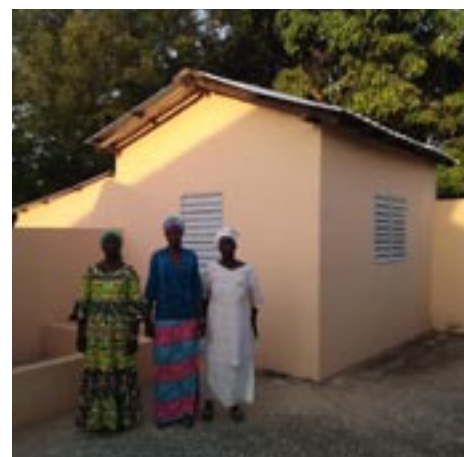
Matrones devant la cuisine de la maternité

Nous avons participé à l'achat de tôles pour réparer le toit de la cuisine et des sanitaires réservés aux femmes après leur accouchement. Depuis, les femmes ont trouvé de l'aide auprès d'une ONG ce qui leur a permis de refaire éga-