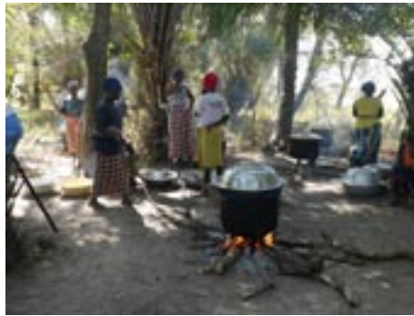
Femmes préparant, à l'ombre, le repas pour tous ceux qui participent au chantier de la digue

La mobilisation de tout ce monde encourage à les soutenir pour l'achat de matériel comme les planches ainsi que l'aide d'un technicien venu avec sa tronçonneuse pour les fa-