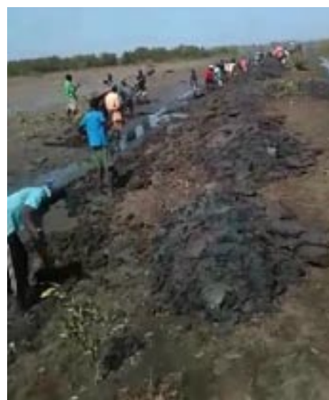
Les populations participent à la réalisation des fondations de la digue avec les moyens à leur disposition.

Il s'agit donc de construire une digue solide et durable avec de petits ponts en bois aux différents endroits profonds.