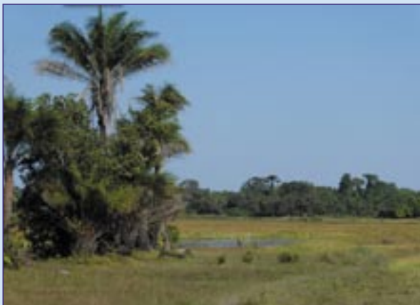
La nature à Youtou ! C'est le Jardin d'Éden !

maintenant des sanitaires complètement opérationnels avec la totalité des carrelages posés, la même équipe nous présente un projet de digue permettant de rejoindre Youtou à Kaguite (Cf article dans cette lettre), nous avons un projet de lampes solaires portables pour que les enfants puissent faire leurs de-