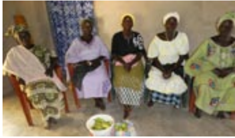
Les femmes du bureau de la machine sont venues remercier APPY pour la réparation du toit en nous offrant des fruits.

L e toit de la maison qui abrite les machines à décortiquer le riz et le mil a été réparé et tout est abrité maintenant.