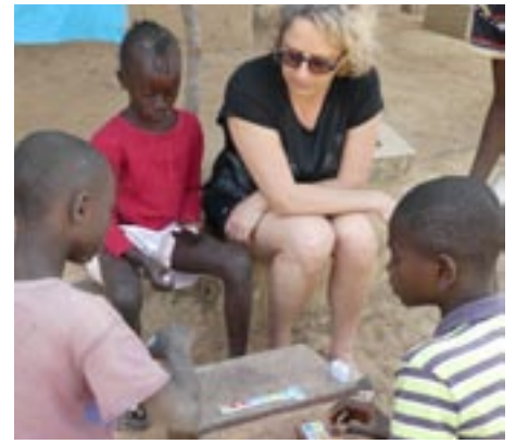
La partie de dominos avec les enfants

On rencontre des gens, on vit avec eux au quotidien, on s'endort à leur côté, on se réveille avec eux, on apprend à les connaître pour certains jusque dans leur intimité. Donc forcément les quitter a été difficile mais nous savons que nous y retournerons.