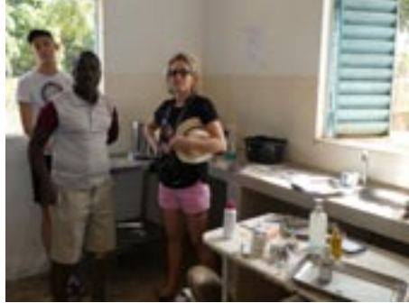
La visite du dispensaire

Et moi, je me suis imprégnée de l'ambiance du village. J'ai partagé des moments conviviaux avec les femmes, les enfants. J'ai pu jouer aux cartes, dominos, billes.