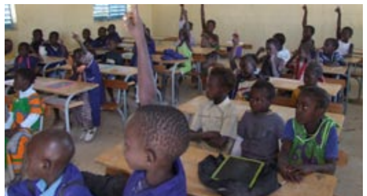
Les enfants attentifs à l'école