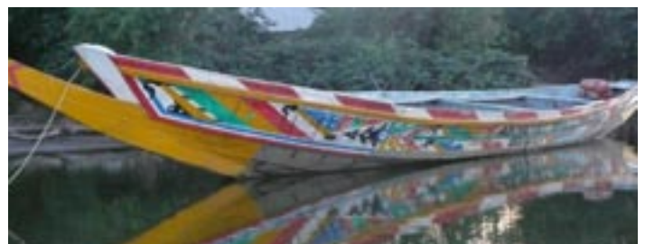
La nouvelle pirogue