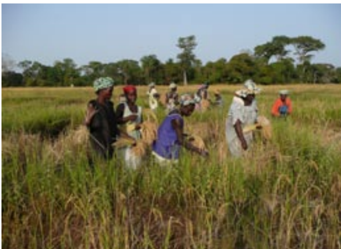
Récolte du riz